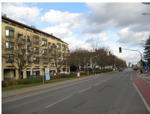
Friedrich-Ebert-Strasse, Göggingen

Nichts erinnert mehr an die düsteren Zeiten. Man hört Kinderlachen, sieht Studenten zur nahen Uni radeln und Menschen mit ihren Autos durch die Straßen kurven. Normalität eben - an einem Ort, der zwölf Jahre lang alles andere als normal war.