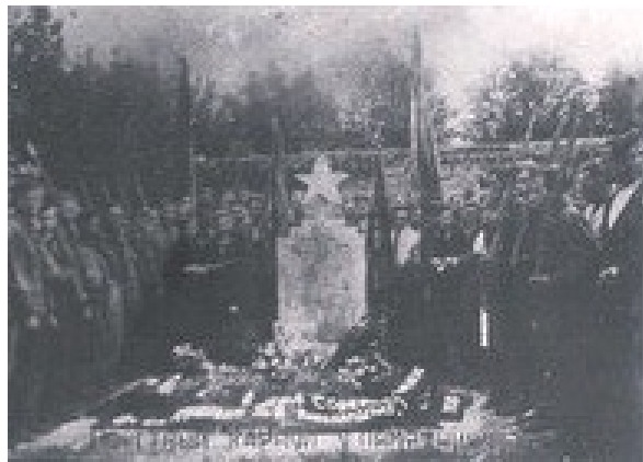
Ehrenwache am Grabmal im Gögginger Friedhof