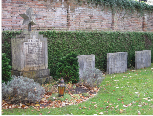
Gräber der Zwangsarbeiter, Friedhof Göggingen

Links und rechts des Ehrenmals liegen weitere 52 Ostarbeiter in den Gräbern, darunter zwölf Frauen. In allen Fällen handelt es sich um sehr junge Russinnen und Russen, unter oder knapp über 20 Jahren, die in ihrer Heimat meist willkürlich aufgegriffen und nach Deutschland verschleppt worden waren.